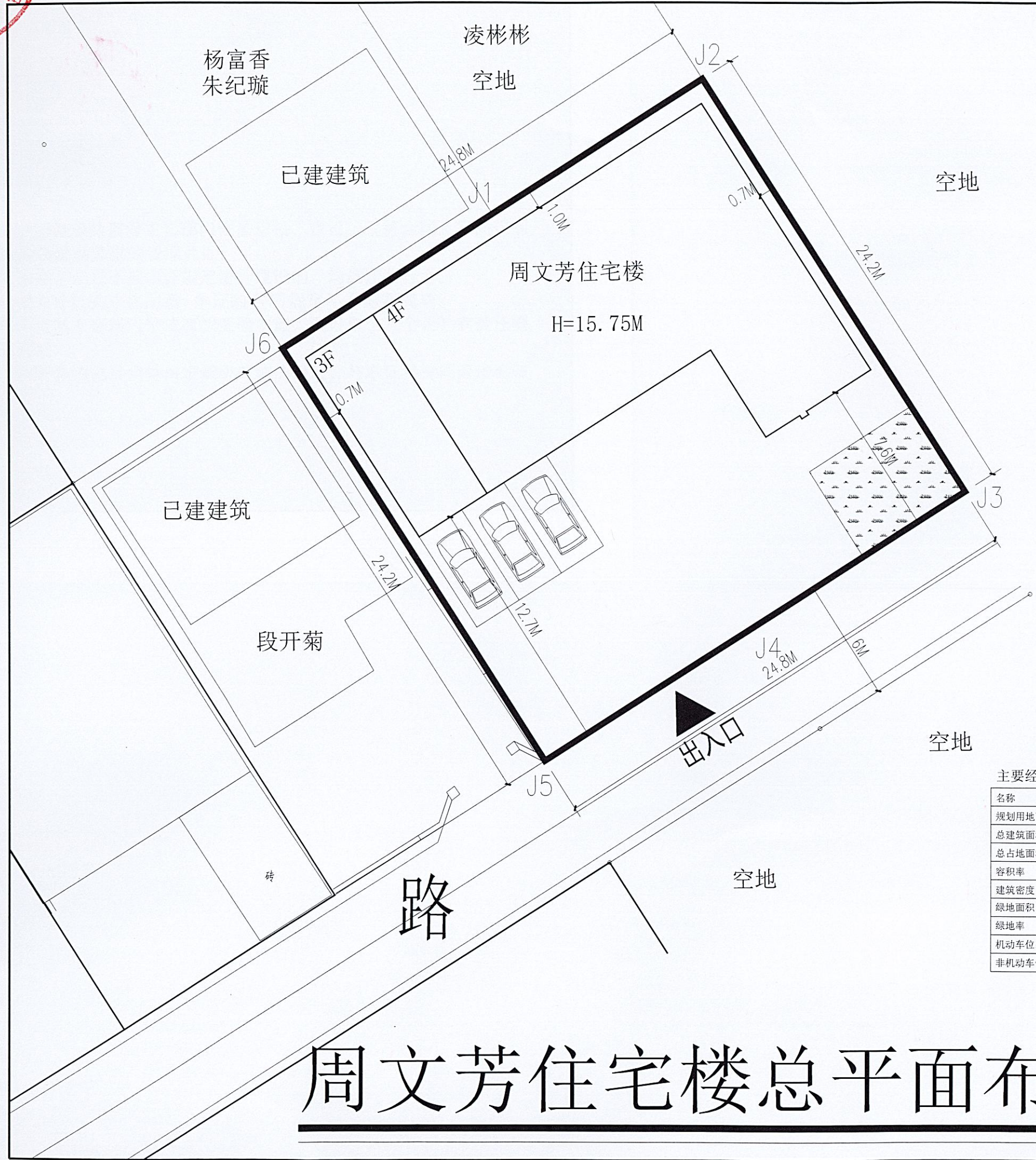
主要经济技术指标表: