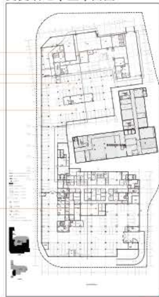
变更后地下室平面图